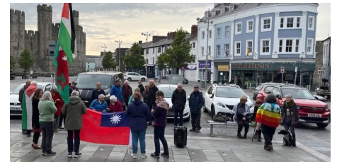
Dangos baner Taiwan yn yr wylnos heddwch wythnosol yng Nghaernarfon

Cawsom y fraint o gael ymweliad gan Arlywydd Taiwan, Dr Lai Ching-Te, yn ystod y Gymanfa hefyd, ac roedd y berthynas o gyd-ddeall a pharch yn amlwg iawn o'r ddwy ochr.