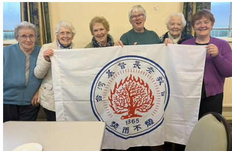
Rhannu am safiad Eglwys Bresbyteraidd Taiwan yn henaduriaeth Dyffryn Clwyd yng Nghapel Bethania, Rhuthun

Mi ges i gyfle i ymateb ar ddiwedd y fforwm a chyfeiriais at sylw'r ferch ifanc hon, gan ddweud ein bod yn cynnal tawelwch ar y maes yng Nghaernarfon bob nos Sul. Addewais y byddwn yn mynd â baner Taiwan yno efo baneri Palesteina/ Libanus/ Iran ac yn eu cynnwys yn y tawelwch fel arwydd o gefnogaeth a chydsefyll. Roeddynt yn hynod o falch o hynny. Felly, dwi wedi mynd â'r faner i eglwys ar ôl dod adre hefyd er mwyn hybu dealltwriaeth o'u sefyllfa.