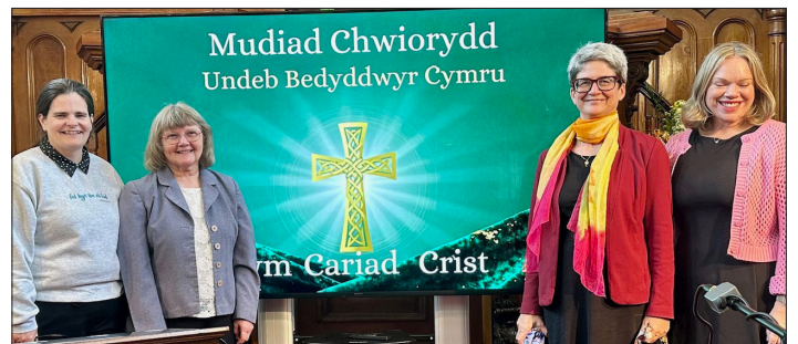
Cyflwyniad Mudiad y Chwiorydd