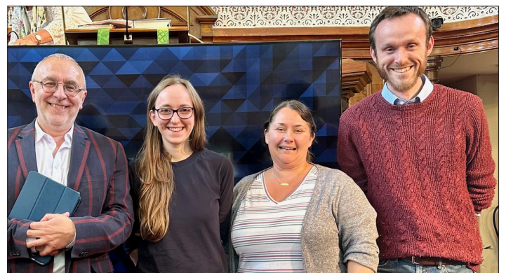
Cyflwyniad Bwrdd y Genhadaeth