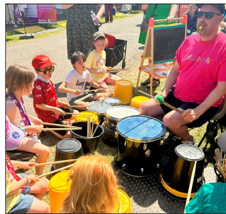
Geth Tomos yn cynnal sesiwn drymio gyda chriw o blant ar y stondin