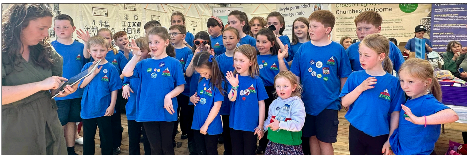
Côr Ysgolion Sul Môn yn canu ym mhbell Cytûn bawn Sul