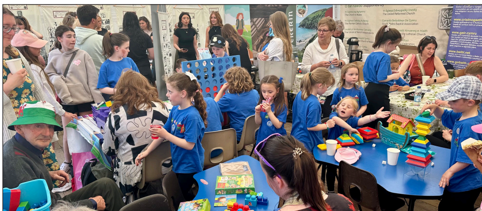
Bwrlwm yn y babell gydag amrywiaeth o weithgareddau i blant