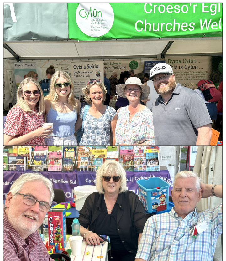
Rhai o'r gwirfoddolwyr fu'n cynorthwyo yn y babell