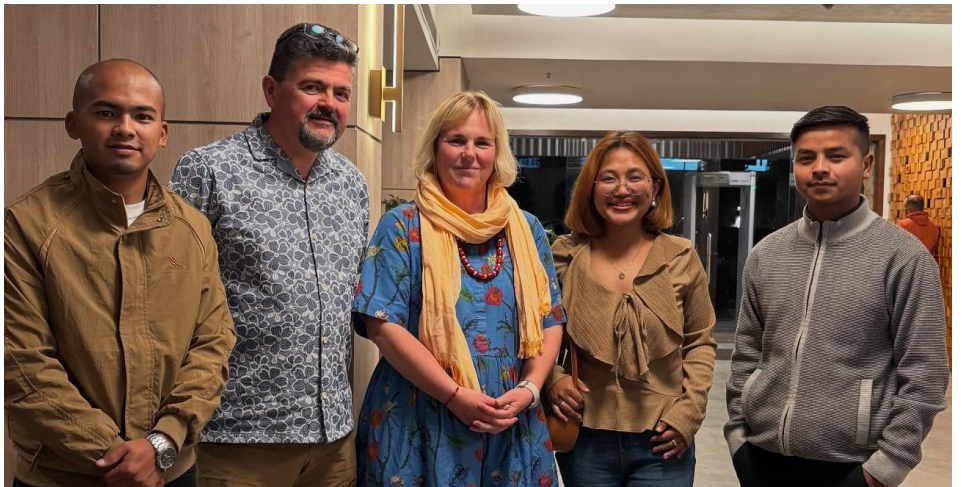
Gyda cherddorion ifanc fu yng Nghymru ar daith yn ddiweddar