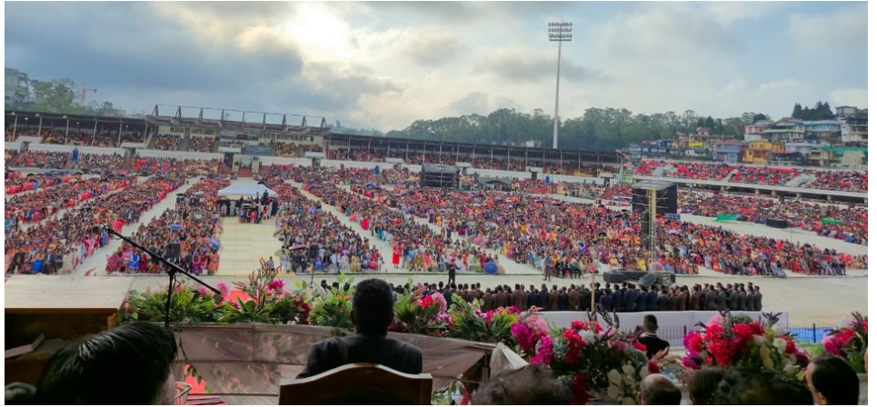
Torf y dathlu ar y Sul yn Shillong

Cawsom ein rhyfeddu gan yr amrywiaeth o bobl oedd wedi dod ynghyd, yn cynrychioli'r eglwysi o gymaint o amrywiol llwythau'r Gogledd-ddwyrain. Mae'r saith talaith yno yn gartref i dros 200 o gymunedau llwythol gwahanol, gyda llwythau'r Naga, y Mizo, y Kuki, y Garo, y Bodo, y Khasi a'r Apatani ymhlith y rhai mwyaf niferus – pob llwyth â'i iaith, ei arferion a'i ddiwylliant unigryw ei hun. Yn ychwanegol at y 200 llwyth, mae sôn wedyn am 300 o is-llwythau, sy'n gwneud yr ardal ymhlith y mwyaf amrywiol yn ddiwylliannol yn Asia.