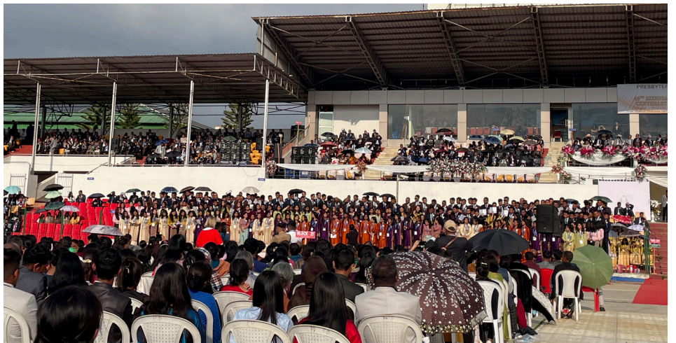
Cor cyfansawdd y Synodau fu'n canu cân y dathlu - 'I Dduw bo'r Gogoniant', a chorws yr Halelwia gan Handel