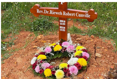
Gosod torch ar fedd y diweddar Robert Cunville, fu lawer gwaith yng Nghymru ac ar ymgyrchoedd efengylu yn ei gyswllt â mudiad Billy Graham