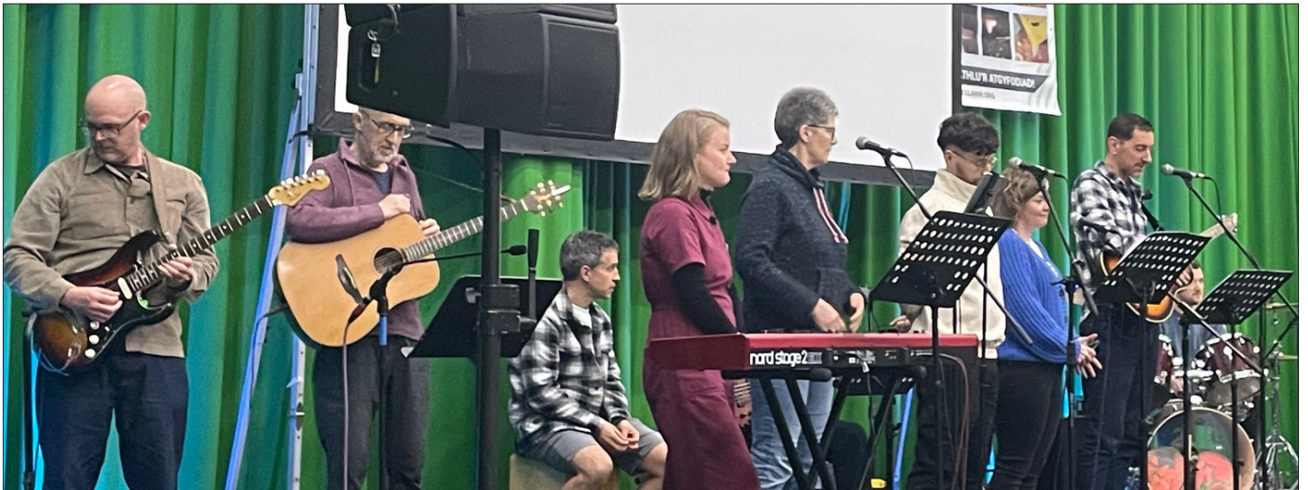
Un o'r bandiau addoli yn arwain y canu o'r llwyfan