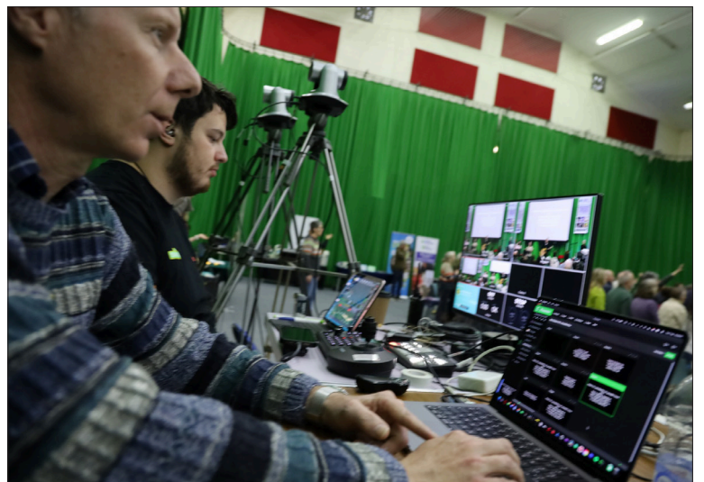
Y tîm prysur o dechnegwyr wrth eu gwaith