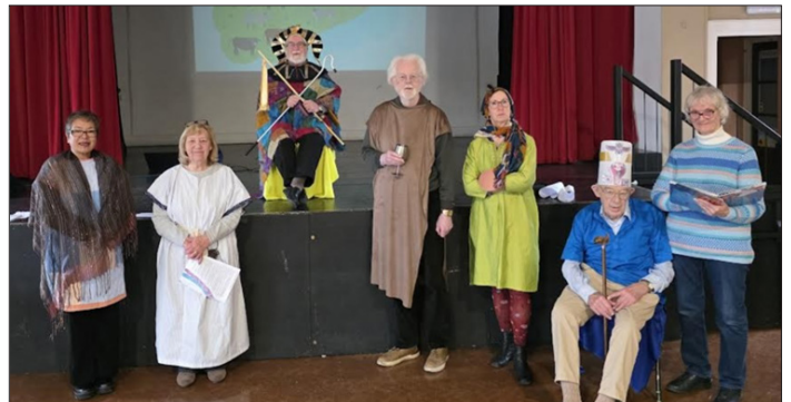
Cyflwyno hanes Joseff yn yr Aiff yn Ysgol Gynradd Aber-miwl

Mae holl aelodau gwirfoddol y tîm Agor y Llyfr egniol hwn wedi eu trwyddedu'n gyfreithiol i weithio mewn ysgolion cynradd, ac mae'r tîm ei hun wedi ei gofrestru'n swyddogol ymhlith cannoedd o brosiectau cyffelyb eraill, sydd yn ymroi i'r cyfryw weithgaredd ledled Prydain, dan awenau Cymdeithas y Beibl yn Llundain. Teg yw dweud bod tîm ymroddgar y Drenewydd yn mwynhau derbyn iad a chroeso diffuant i'w holl weithgareddau, ym mhob un o'r ysgolion yr ymwelir â hwy yn gyson gydol y flwyddyn.