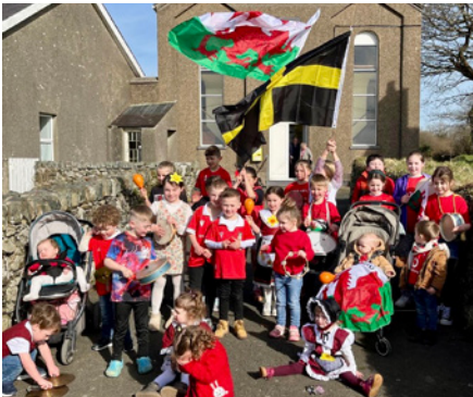
Plant Ysgol Sul Pencaennewydd yn cyrraedd y capel

Tybed sut wnaethoch chi ddathlu dydd Gŵyl Dewi eleni? Ar drothwy'r ŵyl cawsom gystadleuaeth flynyddol Cân i Gymru gan S4C, a diolch am y doniau ifanc a welwyd yn perfformio. Llongyfarchiadau calonnog i fand ifanc Dros Dro ar gyrraedd y brig, ac i bawb wnaeth gystadlu eto eleni.