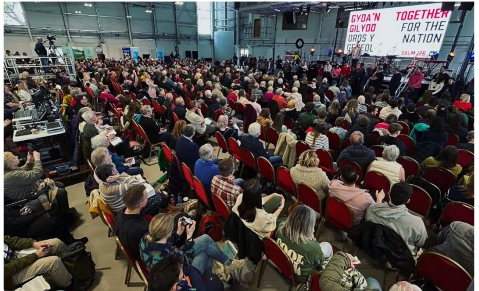
Y gynulleidfa yn addoli

Ond, yn anffodus, fe fethodd Gweinidog yr eglwys fynd i'r achlysur ym Mhen-cael! Roeddwn wedi cychwyn yn blygeiniol i Lanelwedd ar gyfer dathliad Cristnogol wedi ei drefnu gan fudiad 100iGymru. Roeddwn yno'n benodol i lansio cyfres