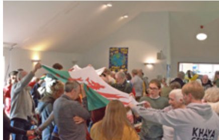
Gweddio dros Gymru