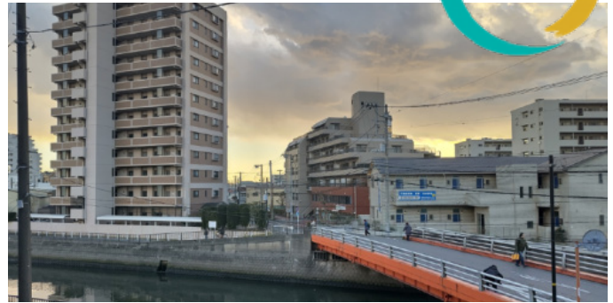
Yr olygfa o'm stafell yn Tokyo

Helô! Tomos sydd yma, a dwi dair wythnos i fewn i fy mlwyddyn yn Japan yn gweithio efo OMF!