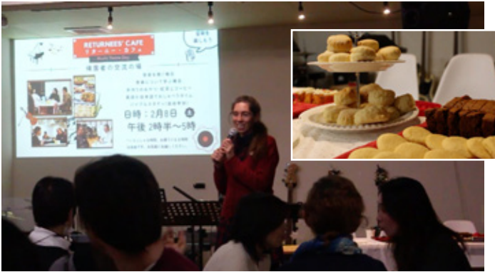
Cyfarfod o'r caffï ar gyfer rhai sy'n dychwelyd a chyfle i flasur te