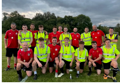
Cystadleuaeth pêl-droed oedolion 'Cwpan y Gofalaethau'