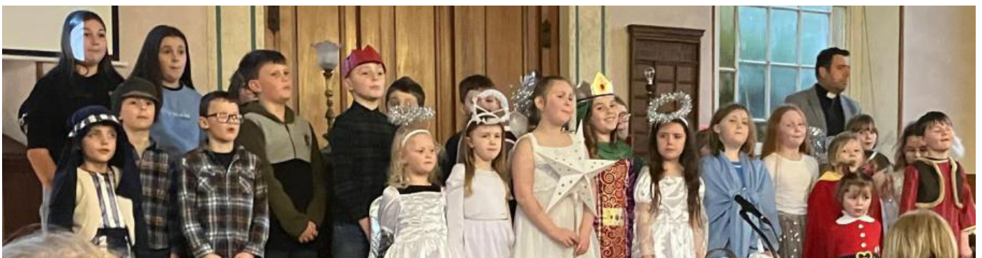
Plant ysgol Sul Pandy Tudur yn cyflwyno'u pasiant Nadolig