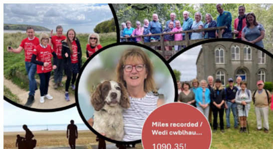
Ymgyrch 'Cerdded' Cymorth Cristnogol

Adroddiad 2041: Mae'r gwaith o greu Sefydliadau Corfforaethol Elusennol Rhanbarthol yn parhau a'r gweithgor bellach wedi bod yn ymgynghori â'r Cymanfaoedd. Bu'r adborth yn hynod galonogol. Mae hwn yn ddatblygiad cyffrous a fydd yn ein cynorthwyo i ddatblygu cynlluniau cenhadol lleol wrth inni ymateb i her ein cyfnod.