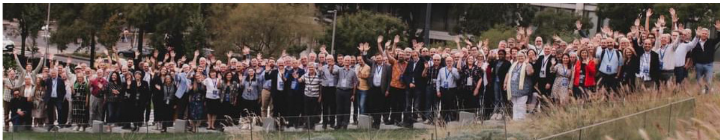
Cynrychiolwyr eglwysi Bedyddiedig yn Budapest

Pleser o'r mwyaf oedd cael bod yn bresennol yng nghynhadledd flynyddol Ffederasiwn Bedyddwyr Ewrop a gynhaliwyd eleni yn Budapest. Cawsom groeso arbennig gan Undeb Bedyddwyr Hwngari, undeb sy'n cynnwys tua 300 o eglwysi a chanddynt 20,000–25,000 o aelodau yn addoli bob Sul.