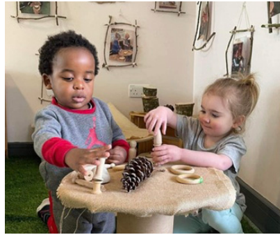
Llun: Llywodraeth Cymru

Mae Llywodraeth Cymru wedi lansio arolwg ar gyfer darparwyr gofal plant, chwarae a gweithgareddau i blant dan 12 oed nad ydynt wedi'u cofrestru gydag Arolygiaeth Gofal Cymru fel Gwarchodwr Plant neu ddarparwr Gofal Dydd o dan Reoliadau Gwarchod Plant a Gofal Dydd (Cymru) 2010 . Byddai hyn yn cynnwys Ysgolion Sul, clybiau ar ôl ysgol, clybiau