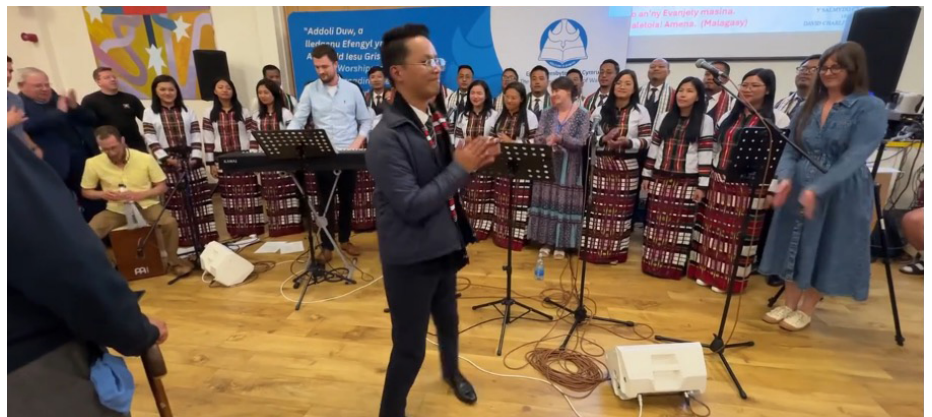
Côr Synod Mizoram yn cloi'r mawl wrth inni ganu 'Diolch i Ti, yr Hollalluog Dduw' mewn Mizo, Malagasi, Cymraeg a Saesneg

arbennig hefyd dros y genhedlaeth iau fel rhan o'r cyflwyniad hwn.