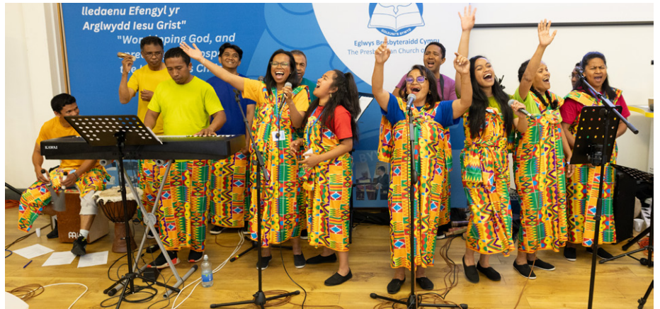
Grŵp Ny Ako o Madagascar yn molï'n llawen drwy ddawns a chân

Ym mlwyddyn y gemau Olympaidd fe gyflwynwyd fideo effeithiol iawn gan lawer o'r rhai yn ein plith sy'n gweithio ymhlith plant, pobl ifanc a theuluoedd, yn pasio fflam ffydd o'r naill i'r llall ar hyd Cymru a Llundain gan ymuno yn y ras sydd wedi ei gosod o'n blaenau. Cafwyd gweddi