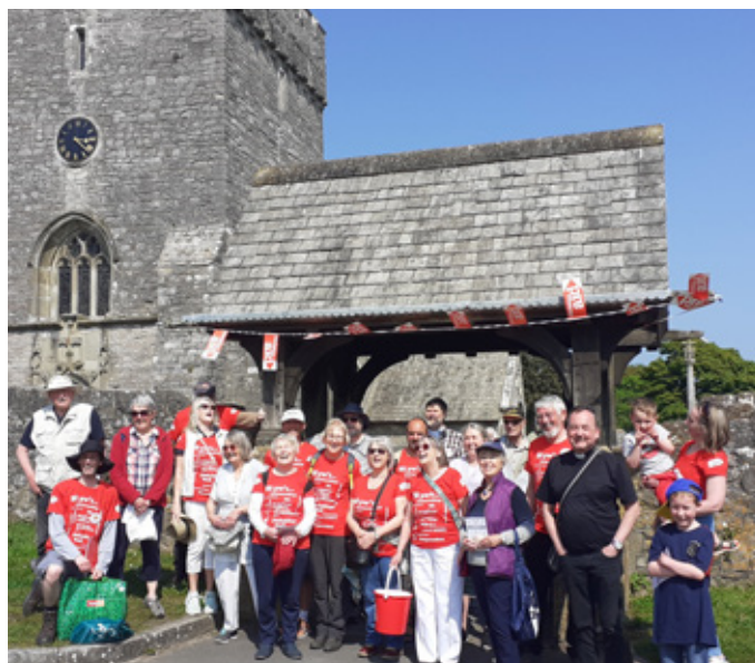
Bydd eglwysi Porthcawl yn cynnal Pererindod Porthcawl, neu 'holy hike' eto eleni – diwrnod o gerdded o gapel i gapel, gyda llawer o gymdeithasu, myfyrio a hwyl ar hyd y ffordd!

Mae Cymorth Cristnogol wedi bod yn gweithio yn Burundi ers 1995 pan ddechreuodd gynnig cymorth dyngarol am y tro cyntaf i bobl oedd wedi goroesi'r rhyfel cartref. Nawr, gyda'n partneriaid lleol, rydym yn helpu i sefydlu Cymdeithasau Cynilo a Benthg Cymunedol. Mae'r grwpiau hyn, sy'n cael eu harwain gan y gymuned, yn golygu y gall pobl gynilo a benthg arian. Yna, mae'n bosibl cael busnesau bach sy'n cynnig incwm dibynadwy ac amrywiol fel y gall teuluoedd fwyta'n rheolaidd, cael meddyginiaeth pan mae ei hangen arnynt, ac adeiladu cartrefi mwy diogel.