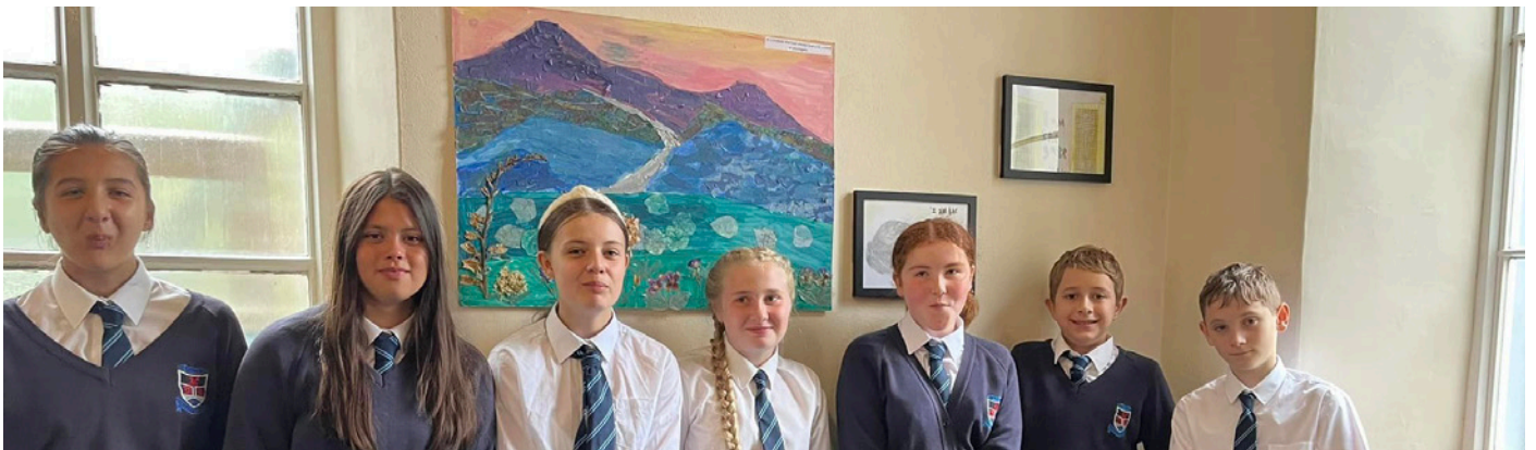
Disgyblion Ysgol Uwchradd Emlyn