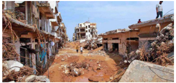
Pobl yn archwilio ardal wedi'i difrodi gan lifogydd dirybudd yn Derna, dwyrain Libya, 11 Medi 2023

“Mae partner Cynghrair ACT Cymorth Cristnogol, Dan Church Aid o Ddenmarc, wedi sefydlu presenoldeb yn Libya ers 2011, ac mae bellach yn helpu gyda'r ymateb brys. Mae staff DCA yn nwyrain y wlad yn cynorthwyo Cilgant Coch Libya yn Derna ei hun, yn benodol gyda chymorth meddygol i'r timau chwilio ac achub. Mae staff logisteg a staff maes DCA yn caffael eitemau sylfaenol ar gyfer y llochesi er mwyn helpu teuluoedd sy'n cyrraedd yno'n waglaw.