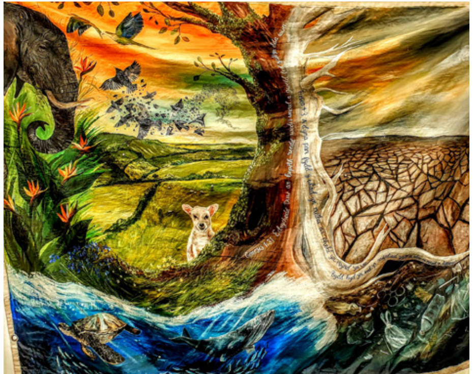
Murlun argyfwng hinsawdd Cymorth Cristnogol

Diolch yn fawr iawn i'r llu fu'n gwirfoddoli drwy roi o'u hamser wrth ein bwrdd yn ystod yr wythnos; hebdoch chi mi fyddai bod yn bresennol drwy'r dydd, bob dydd,