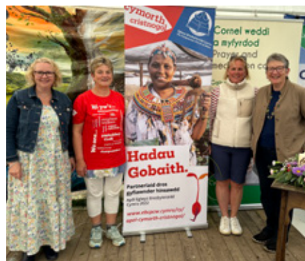
Cynrychiolwyr o EBC yn datlu diwedd eu hapêl Hadau Gobaith