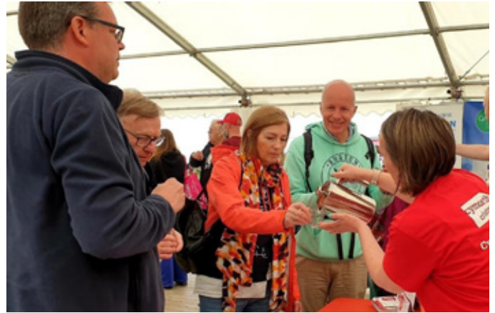
Profi'r coffi ar y stondin

'Erbyn i chi orffen eich brecwast heddiw, fe fyddwch chi wedi dibynnu ar fwy na hanner gweddill y byd.'