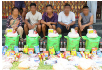
Rhai Cristnogion a effeithiwyd gan y trais wedi derbyn rhoddion i'w helpu

Adroddodd Fforwm Arweinwyr y Llwythau Cynhenid fod y treisio hwn wedi digwydd