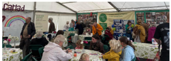
Bwrllwm y babelll wrth i bobl fwynhau sgwrs a phaned