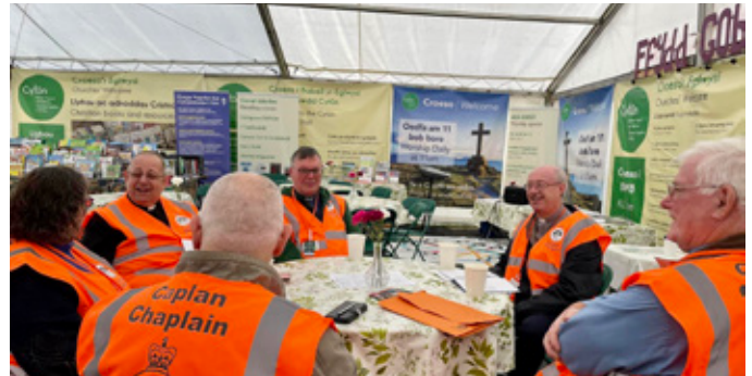
Y caplaniaid yn trafod gwaith y dydd cyn cychwyn allan i grwydro'r maes