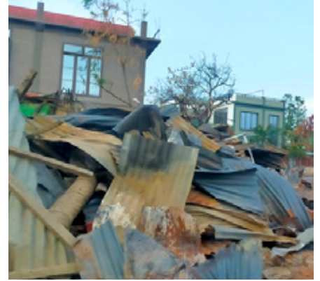
Tŷ Cristnogion wedi'i ddiestro