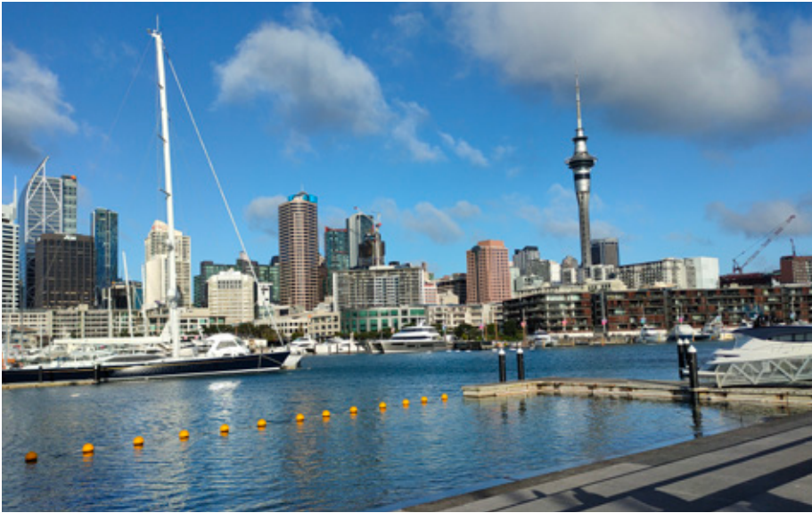
Auckland, Seland Newydd

Wrth deithio'n ddiweddar o Gymru i ben arall y byd – i wlad y cwmwl hir, gwyn; y ciwi a'r parot; y Maori, y gwynion, pobl yr ynysoedd a'r dwyrain pell ac India; i wlad bryniau folcanig a ffynhonnau poeth – dyma fyfyrion ar y pellter a'r ehangder byd-eang o'r gorllewin i'r dwyrain.