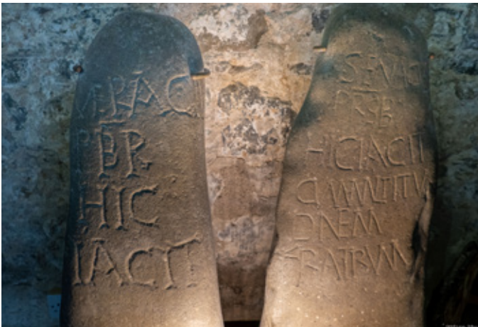
Cerrig bedd cynnar yn eglwys Aberdaron

O ddyddiau seintiau cynnar y 5ed, y 6ed a'r 7fed ganrif ymlaen mae Cristnogaeth wedi gadael ei hôl yn amlwg ar Llŷn ac Eifionydd. Yng nghyntedd Oriol Plas Glyn-y-weddw yn Llanbedrog gwelir dau faen Cristnogol cynnar, y naill yn coffáu, mewn Lladin, Iwfenal fab Edern ac yn dyddio o'r chweched ganrif, a'r llall o bosib yn hŷn ac yn dyddio o'r 5ed ganrif. Ar hwnnw coffeir Vendesetli ('Un o fywyd gwynfydedig'), ffurf gynnar ar yr enw Gwynhoedl, nawddsant eglwys Llangwnnadr yn ddiweddarach. Cawsent eu darganfod tua dechrau'r 1830au wrth chwalo hen fwthyn ar dir fferm Penprys ym mhlwy Llannor, wedi eu hailddefnyddio i ffurfio ochrau bedd hynafol.