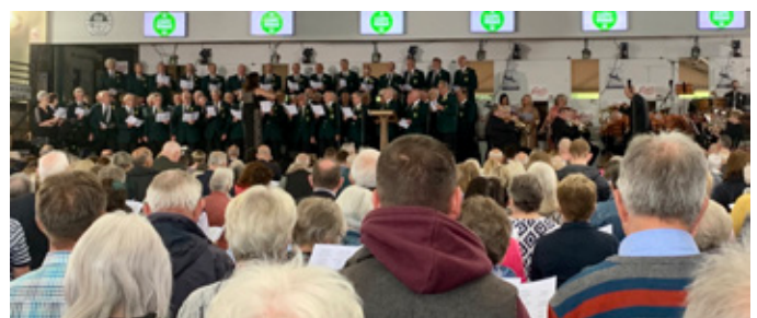
Y gynulleidfa a'r côr ym 'Moliant y Maes' ar y nos Sul