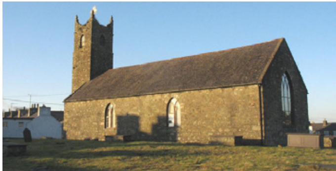
Eglwys Nefyn – Amgueddfa Forwrol Llŷn bellach

Y mae eglwys Beddgelert, ym mhen eithaf Eifionydd, yn cynnwys elfennau o'r hen briordy yno sy'n dyddio o'r 12fed a'r 13eg ganrif. Gwelir eglwysi trawiadol eraill yn Llanengan, Llaniestyn, Llangwnnadr ac Aber-erch. Yno yn y fynwent y mae bedd bardd y Betws Fawr, Robert ap Gwilym Ddu.