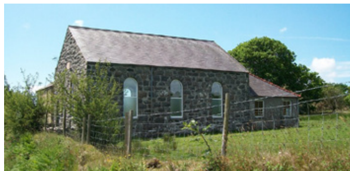
Capel y Beirdd

Er mai mudiad i ddiwygio'r eglwys o'r tu mewn oedd Methodistiaeth ar y cychwyn, buan y troes y seiadau yn gapeli a chafwyd prydles i godi capel ar dir Tŷ Mawr, Bryncroes, yn 1752. Roedd hwnnw dros y ffordd i'r capel presennol, a godwyd yn 1840. Cofnodir bod pregethu ym Mrynengan, 'Jerusalem Sir Gaernarfon' ym mhlwyf Llanybi yn Eifionydd yn 1755 ond yn 1776 y cafwyd les gan y tîrffediannwr i godi capel yno.