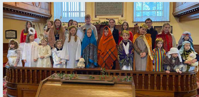
Plant ac ieuencid ysgol Sul Rhydfendigaid, Ponrhydfendigaid, yn eu gwasanaeth Nadolig