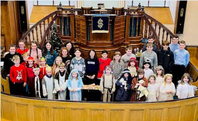
Gwasanaeth Nadolig Capel Bwlch-gwynt, Tregaron