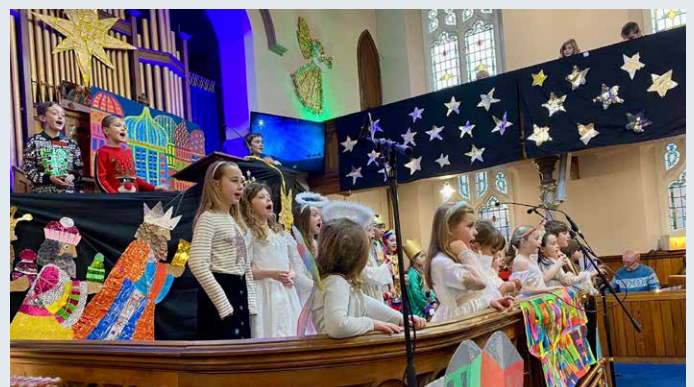
Gwasanaeth Nadolig Capel Salem, Treganna, Caerdydd