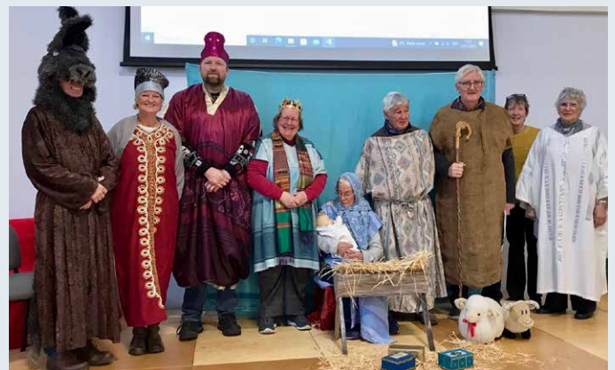
Criw Agor y Llyfr cylch Bangor yn ymweld ag Ysgol Glancegin i gyflwyno stori'r Nadolig