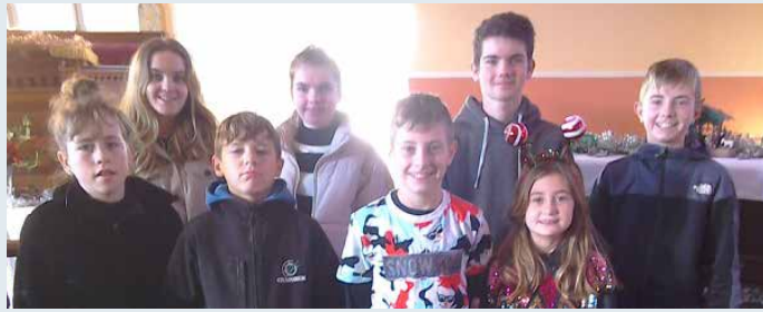
Capel Pen-llwyn, Ceredigion

A gan fod un llun yn cyfleu mwy na'r hyn sy'n cael ei gyfleu mewn mil o eiriau, rydym yn falch o gynnwys cyfres o luniau sy'n tystio i'r llawenydd a rannwyd dros yr ŵyl.