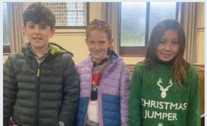
Capel Madog, Ceredigion