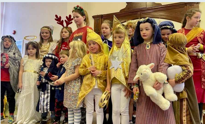
Gwasanaeth Nadolig Capel Bethania, y Felinheli