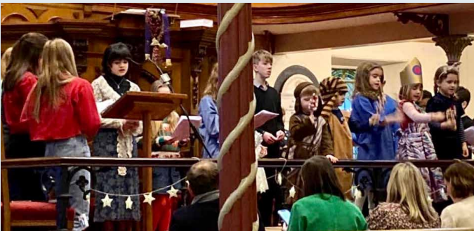
Plant ysgol Sul y Tabernacl, Caerdydd, yn cyflwyno'u gwasanaeth Nadolig