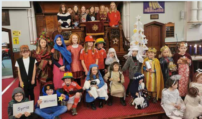
Capel y Morfa, Aberystwyth