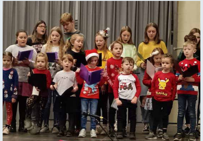
Ysgol Sul Rhydfendigaid yn canu carolau ym Marchnad 'Doligy Bont ym Mhafiliwn Ponrhydfendigaid