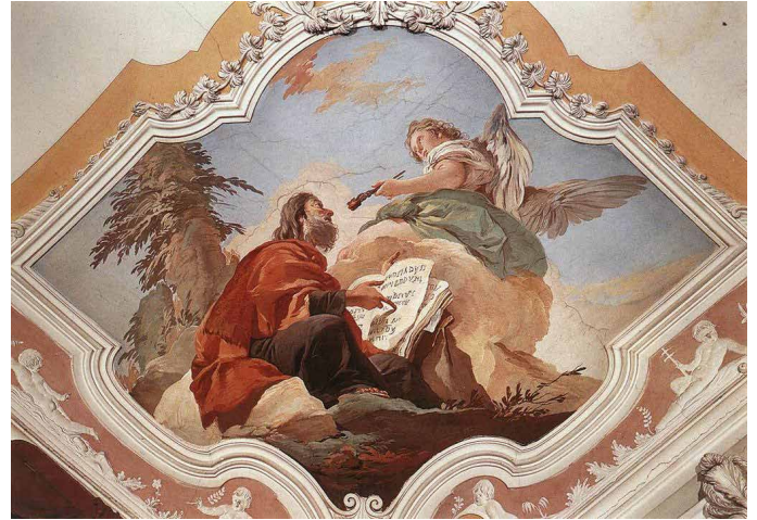
Llun gan Giovanni Battista Tiepolo https://www.artbiblia.info/art/large/469.html

Yna daeth neges o'r nef, nid i fychanu cyffes Eseia o bechod, ond i gyhoeddi glanhad. Daeth marworyn tanllyd i gyffwrdd â'r aflan,