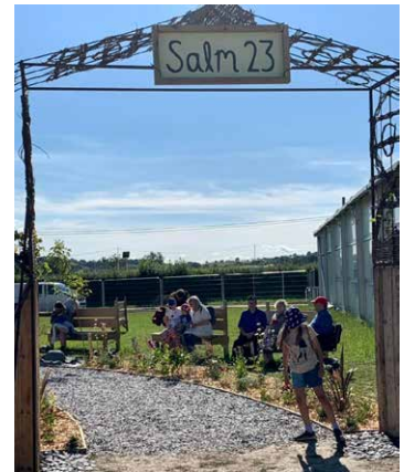
Tu allan i'r babell, dan nawdd Cymdeithas y Beibl, roedd yna ardd Feiblaidd, wedi ei hysbrydoli gan ardd o Sioe Flodau Chelsea. Trwy glicio ar ddolen i wefan ar eich ffôn, roedd modd gwrandao ar fyfyrdd pum munud yn esbonio ystyr ac arwyddocâd Salm 23.