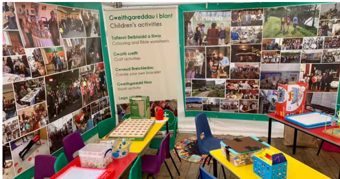
Cornel gweithgaredd y plant – braf fu cael cyfeillion o fudiad Plant Dewi yn gwirfoddoli gan drefnu amrywiaeth o grefftau a gweithgareddau ar gyfer y plant.