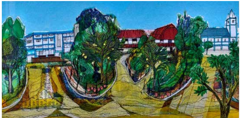
Darlun mewn pwyth, print a thecstil o Ysbyty Gordon Roberts yn Shillong gan yr artist Cefyn Burgess

Bellach, er nad oes gennym genhadon yng ngogledd-ddwyrain India, mae gan