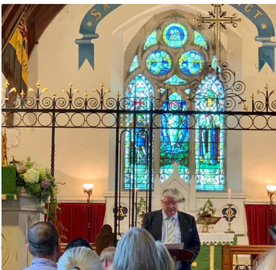
Traddodiad eisteddfodol blynyddol yw'r offeren o dan nawdd yr Eglwys Gatholig, a gynhaliwyd eleni yn Eglwys y Santes Fair yn Nhregaron.