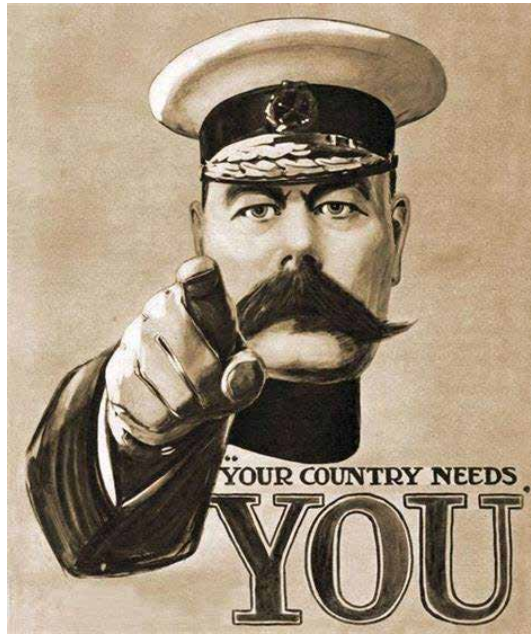
Adleisiau o alwad dychrynlyd y Rhyfel Byd Cyntaf i'w gweld ar faes y Sioe eleni

Mae'r cysylltiad rhwng y Sioe a'r fyddin yn hanesyddol wedi bod yn un glòs, â nifer o sioeau ceffylau'n diddori'r dorf sawl gwaith y dydd, a thanio'r gynnu'n digwydd yn rheolaidd, heb anghofio am hedfaniadau dyddiol y Spitfires uwch maes y Sioe. Mae'n debyg fod dros 250 o wirfoddolwyr milwrol yno, gan gynnwys plant a phobl ifanc y cadetiaid. Roedd y stondinau hyn yn rhai byrlymus a hwyliog iawn, a thorfeydd o deuluoedd yn ymgasglu