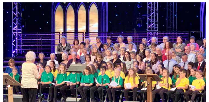
Nifer o'r rhai fu'n cymryd rhan yn yr oedfa yn y pafiliwn