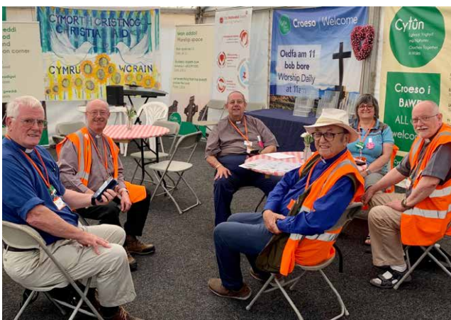
Y caplaniaid cyn cychwyn allan ar waith y dydd

Diolch am weledigaeth Tir Dewi, ac am eu hawydd i weithio ar draws yr enwadau i gynnig gwasanaeth i bawb mewn angen. Diolch hefyd am waith a thystiolaeth yr eglwysi ar faes y Sioe – a braff fyddai gobeithio, erbyn 2023, y bydd mwy o blith eglwysi anghydfurfiol Cymraeg Cymru yn ymuno yn y genhadaeth. Tybed a yw Duw yn eich galw CHI?