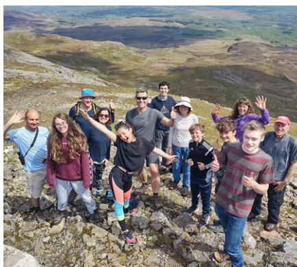
Wedi cyrraedd copa'r Arennig Fawr