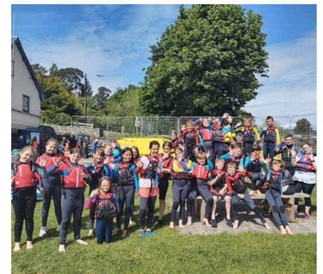
Criw Miri Mai yn barod i fynd ar Lyn Tegid

fy ffydd gymaint oherwydd Coleg y Bala ac felly wedi dewis gwneud y flwyddyn gap yma i gael siawns i roi yn ôl a gweld Cristnogion ifanc eraill yn tyfu yn eu ffydd. Cefais glosio at Iesu yn ystod y flwyddyn yr oeddwn i yma i ddechrau'r cwrs, a rŵan dwi'n ôl dros yr haf ac yn cael y siawns i arwain mwy o gyrsiau a chlybiau. Mi fyddwn yn gwerthfawrogi eich gweddïau yn fawr. Diolch.