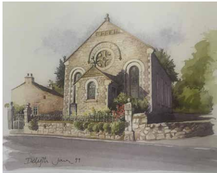
Capel Carmel: Darlun dyfrlliw o Gapel Carmel gan Delyth Jones

Bu'r gwasanaeth olaf yng nghapel Carmel ar ddechrau'r pandemig ar 8 Mawrth 2020 dan ofal y Parch. Huw Powell-Davies. Ef hefyd gyflwynodd neges yn y gwasanaeth hwn ar Iesu, yr Alfa a'r