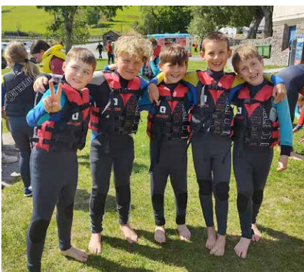
Edrych ymlaen at gael hwylio ar gwrs Miri Mai