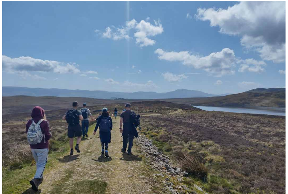
Ar y ffordd i ben yr Arennig Fawr ar gwrs cerdded mis Mai

leol ac ymysg plant ac ieuentid. Mae hefyd yn ffordd o roi yn ôl i'r Coleg am yr holl fudd dwi wedi'i gael o'r gwaith yma. Ar hyn o bryd rydyn ni'n brysur yn cynllunio clybiau a chyrsgiau sydd ar y gorwel agos ac rwy'n llawn cyffro amdanynt.