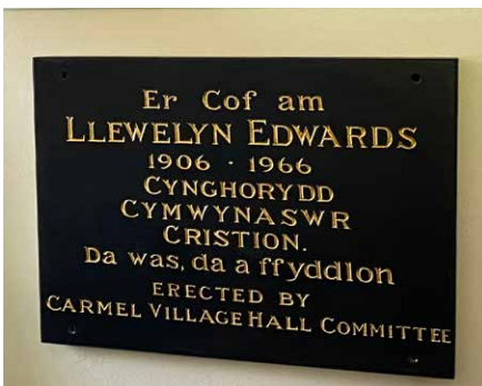
Y gofeb a adleolwyd i'r neuadd