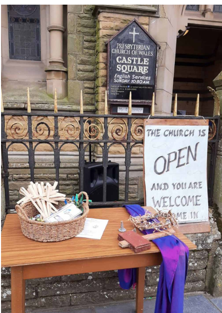
Gweithgaredd y Pasg ar y Maes