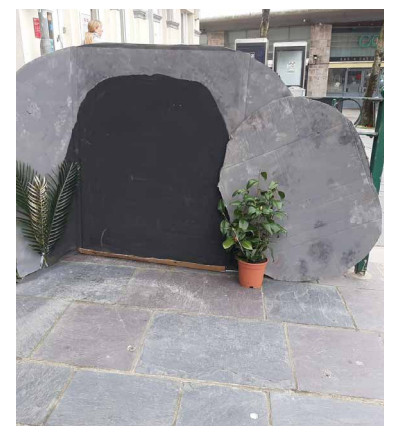
Golygfa'r Bedd Gwag ar y Maes