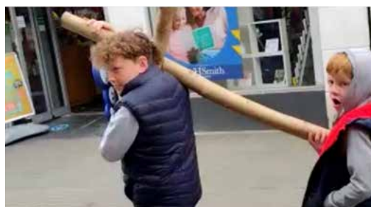
Yr hogiau yn cario'r groes i lawr Stryd Llyn