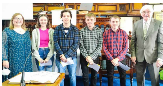
Y rhai gafodd eu derbyn yn Salem gyda'r gweinidogion