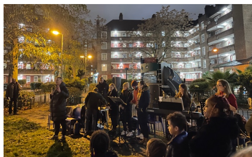
Gwasanaeth carolau ar ganol y stad yn 2021