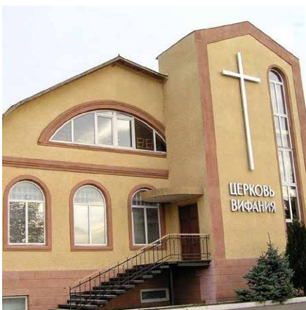
Eglwys Fedyddiedig Bethany yn Mariupol cyn y dinistr

Mi fyddaf yn mynd i Balaton yn ystod mis Mai, ac yn gobeithio cyfarfod rhai o'r arweinwyr hyn sy'n gweithio mor ddiwyd. Fe fydd mwy i'w rannu yn Cenn@d bryd hynny, gobeithio.