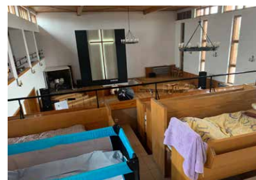
Eglwys Bedyddwyr Chelm yn defnyddio'r adeilad i letya ffoaduriaid