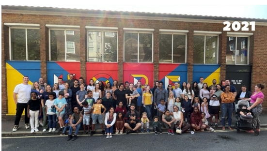
Yr eglwys adeg ei sefydlu yn 2018 (uchod), ac yna dair blynedd yn ddiweddarach (isod)