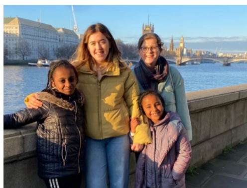
Gwawr gyda rhai o'r aelodau ifanc