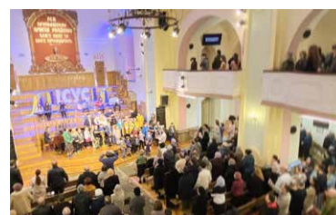
Dathlu Sul y Blodau yn Eglwys y Bedyddwyr, Lviv