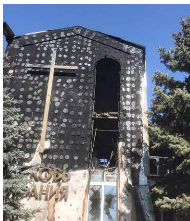
Eglwys Fedyddiedig Bethany yn Mariupol wedi'r bomio diweddar