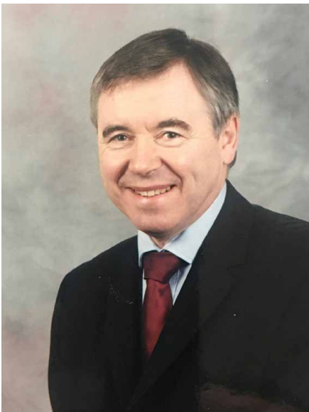
Ieuan Wyn Jones

Mae Ieuan Wyn Jones yn adnabyddus fel cyn-Ddirprwy Brif Weinidog Cymru tan 2011, ond llai adnabyddus yw ei weithgarwch ef a chriw o bobl leol eraill yn ardal Llangefni gyda chapeli'r dre – yn agor cwys newydd i'w dyfodol.