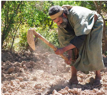
Teyrnas nefoedd fel dod o hyd i drysor yn y cae (Lumo Project).

Nid pawb sy'n dweud wrthyf, 'Arglwydd, Arglwydd', fydd yn mynd i mewn i deyrnas nefoedd, ond y sawl sy'n gwneud ewyllys fy Nhada, yr hwn sydd yn y nefoedd. Bydd llawer yn dweud wrthyf yn y dydd hwnnw, 'Arglwydd, Arglwydd, oni fuom yn proffwydo yn dy enw di, ac yn dy enw di