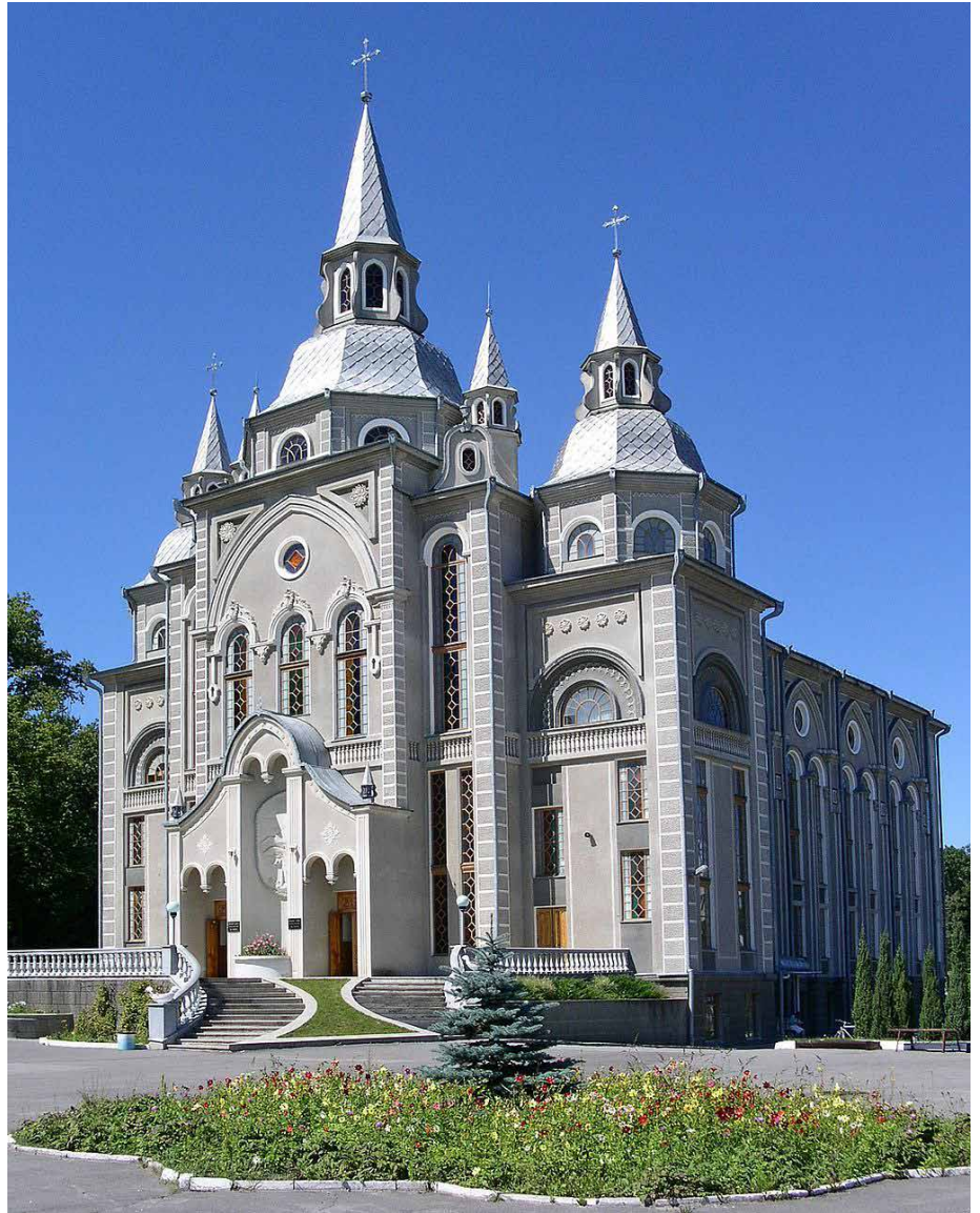
Capel Bedyddwyr Wcráin gan Håkan Henriksson (Narking)

Parhawn i weddio yn daer ac yn gyson dros y sefyllfa yno.