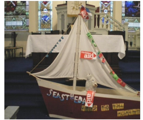
Cwch cyfiawnder hinsawdd, Eglwys St Paul, Dundee.

Adeiladodd y bobl ifanc gwch cyfiawnder hinsawdd, Seas the Day , a gafodd ei ailgylchu gan blant heddiw o gwch a wnaed flynyddoedd yn ôl gan genhedlaeth flaenorol o bobl ifanc. Tynnwyd y cwch ar droli cartref wedi'i ailgylchu o Meadowside St Paul,