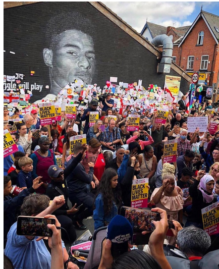
Murlun Marcus Rashford

Drama ydy mynd ar un glin cyn gêm bêl-droed. Poeni mae Priti Patel mai dim ond 'gesture politics' ydy hynny. Wrth gwrs mai dim ond gweithred ydy hi, ond mae awgrymu nad oes dim poen, gweledigaeth, polisi a strategaeth y tu ôl iddi yn datgelu lle mae hi a'r bobl sy'n