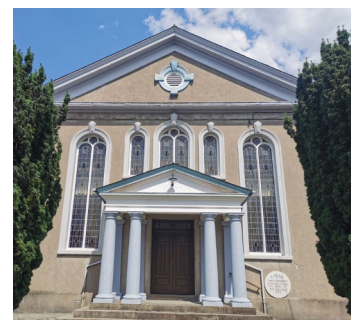
Capel y Graig