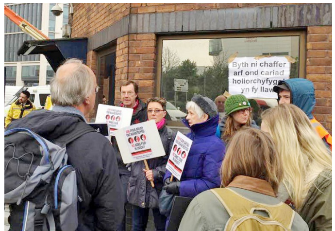
Protest yn erbyn Ffair Arfau yng Nghaerdydd, 2019 (Sylwer ar y dyfyniad o'r emyn yn y cefndir)

Am ei fod yn fyd pechadurus, dydi cyfiawnder ddim yn dod yn hawdd. Dyna pam fod yn rhaid i Gristnogion a diwygwyr cymdeithasol